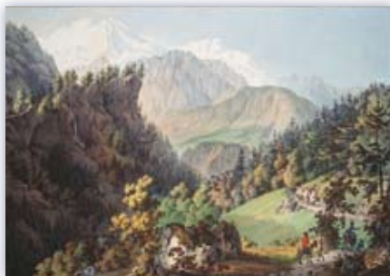
Jean-Daniel HUBER / Eaux-fortes colorées Vue de l'entrée de la vallée de Chamoniix