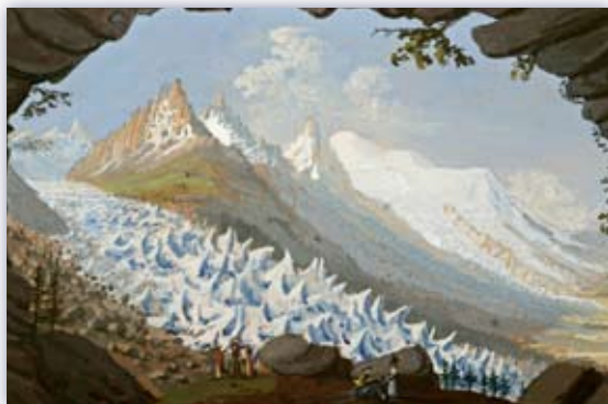
Jean DUBOIS / Grotte Vue prise de la voûte du Chapreau, vallée de Chamoniix